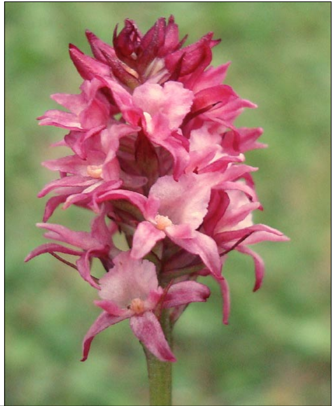
Links: Elke Trummer vor ihrer Entdeckung. Rechts: Gymnadenia odoratissima × Nigritella stiriaca . Zinken, 10. Juli 2008.