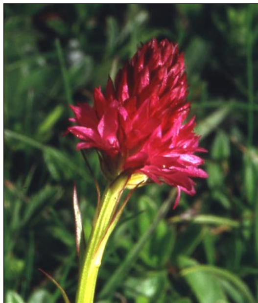
Nigritella × petzenensis (= Nigritella lithopolitana × rhellicani). Hochobir, 26.6.1995.